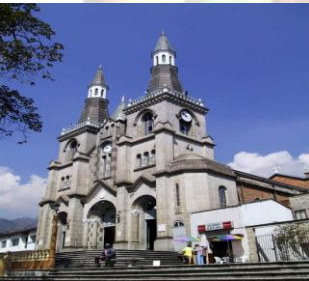
Templo Nuestra Señora del Rosario de Chiquinquirá (Municipio de la Estrella –Ant.-).