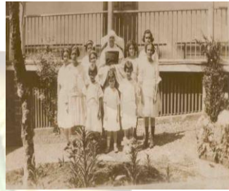
Sus primeros años de Colegio