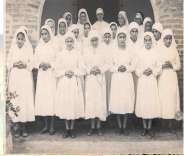
Hermanitas de la “Selva Verde”

El 3 de enero de 1967 la obediencia le pide ir a la ciudad de Medellín como superiora local de la Casa Provincial. Dice la Madre: “fue para mí una gracia especial de Dios. Las hermanas, todas estudiantes, no tenían mayores problemas. Pude dedicarme por completo a la oración y el silencio. Aquí terminé de madurar la idea de la nueva fundación”.